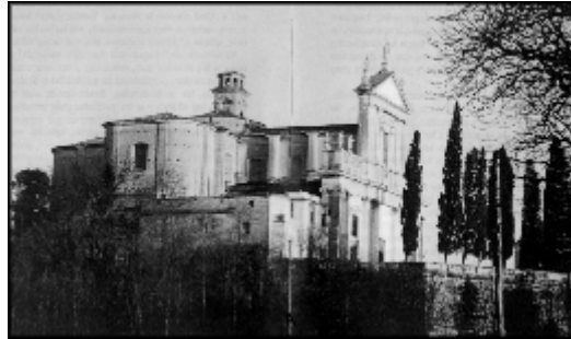
Castiglione delle Stiviere (Chiesa Maggiore)

toda graduación, los unos con los otros (de caballería, de infantería, de artillería), llenos de sangre, extenuados, cubiertos de harapos y de polvo; después, mulos que llegan al trote, y cuya carrera arranca, cada instante, agudos gritos a los desdichados heridos que transportan. La pierna de uno está rota y parece estar desprendida de su cuerpo; cada tumbo de la carreta que lo lleva le causa nuevos sufrimientos. Otro tiene un brazo partido y, con el que le queda, sostiene y protege el miembro fracturado; un cabo tiene el brazo izquierdo atravesado por la baqueta de un lanzagranadas, baqueta que retira por sí mismo, y finalizada la operación, la utiliza como bastón para poder llegar a Castiglione; pero varios expiran queriendo avanzar; se dejan sus cadáveres a la orilla del camino, y ya se volverá más tarde para enterrarlos.