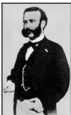
J.-Henry Dunant (1828-1910)

Esta obra es el punto de partida de un movimiento que, actualmente, está integrado por millones de miembros en el mundo. El mensaje de su autor, conocido en todas partes, ha conmovido y sigue conmoviendo a los lectores. "Al terminar el libro, se maldice la guerra" escribían, el siglo pasado, los hermanos Goncourt. Desde su publicación, en 1862, Recuerdo de Solferino ha sido traducido y reeditado tantas veces que es difícil saber cuántas versiones hay en el mundo.