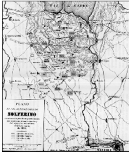
Trazado según las indicaciones del autor

En el ataque contra el monte Fontana, son diezmados los tiradores argelinos, mueren sus coroneles Laure y Herment, sucumben muchos de sus oficiales, lo que redobla su furor; para vengar a tantos muertos, se excitan y se abalanzan, con rabia de africanos y con fanatismo de musulmanes, contra sus enemigos matándolos con frenesí y como tigres sedientos de sangre. Los croatas se echan al suelo, se esconden en las zanjias, dejando que se acerquen sus adversarios para, después, alzarse de repente y matarlos a quemarropa. En San Martino, es herido un oficial de bersaglieros, el capitán Pallavicini; sus soldados lo llevan en brazos hasta una capilla, donde recibe los primeros auxilios, pero los austríacos, momentáneamente rechazados, vuelven a la carga y penetran en ese lugar sagrado; los bersaglieros, demasiado poco numerosos para resistir, abandonan a su jefe; inmediatamente, croatas, con grandes piedras que hay a la puerta, machacan la cabeza del capitán, cuyos sesos salpican sus guerreras.