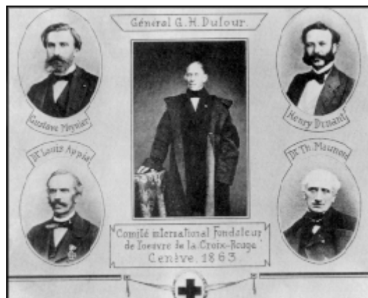
Comisión llamada "de los Cinco"